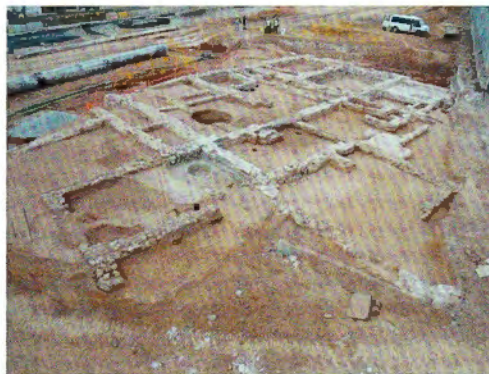
Figura 3. Vista general de la masia.

tuació i impossibiliten conèixer l'extensió total de la masia, la part documentada dibuixa una planta de 18 metres per 19,70 metres amb un gran nombre de compartimentacions interiors.