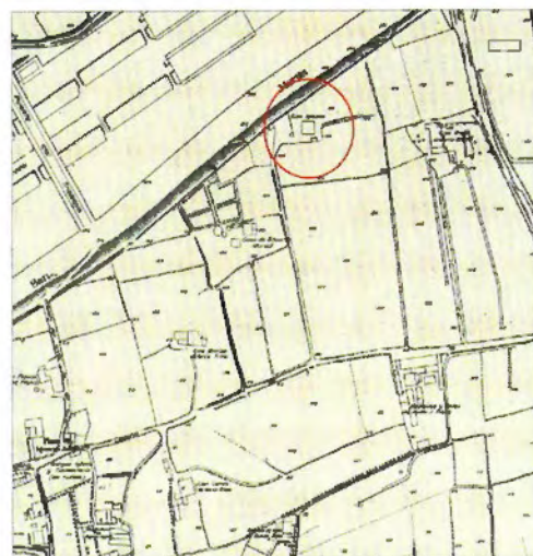
Figura 8. Plànol topogràfic de l'Ajuntament de Barcelona. 1933. ICC.

Aquest canvi en l'urbanisme de la zona s'observa també a les fonts documentals de l'època. Si comparem el plànol topogràfic de l'Ajuntament de Barcelona de l'any 1836 (figura 8) amb el de l'any 1933 (figura 2) veiem com part dels terrenys que a principis del segle XIX formaven part de Can Iglesias, l'any 1933 ja restaven amagats sota la ronda de Sant Martí.