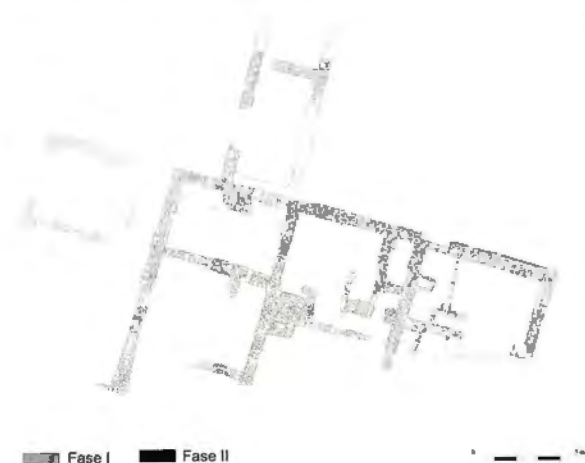
Figura 5. Planta de l'edificació de la fase II.

Observem una amplària de 5 metres per a la nau sud, mentre que les altres dues naus presenten una amplària de 5,5 metres. La longitud dels àmbits està condicionada a l'ús individualitzat de cada espai, ús que malauradament a causa de l'acusat estat d'arrasament de l'edifici ens és de difícil interpretació en alguns àmbits.