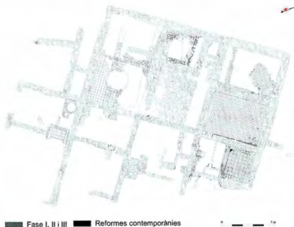
Figura 7. Planta final de la masia.

Al segle XIX es manté l'estructuració de la masia a excepció de la nau S del cos construït al segle XVIII, que passarà d'un a dos àmbits de planta quadrangular, mitjançant la construcció d'un envà (figura 7). Ambdós espais es pavimenten amb rajola, fet que provocarà l'amortització de la sitja oberta al segle XVIII.