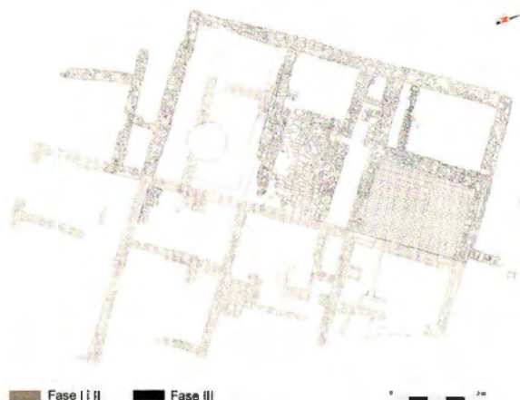
Figura 6. Planta de l'edificació de la fase III.

L'ampliació segueix el mateix sistema estructural, conformat per un cos rectangular dividit en tres naus subdividides a la vegada en àmbits, encara que, a diferència de la fase anterior, ara no totes les naus estaran compartimentades en dos àmbits sensiblement quadrangulars.