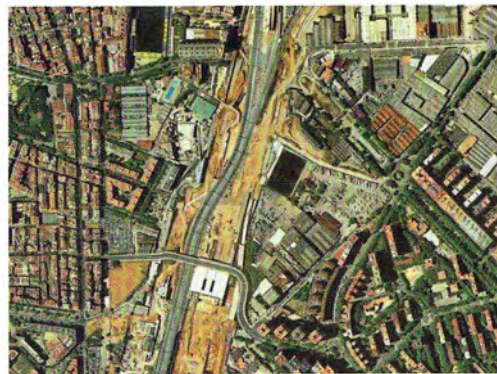
Figura 1. Ortoimatge actual de l'àrea on es localitzava la masia (ICC).

La nostra intervenció, desenvolupada sota la desaproteguda ronda de Sant Martí al tram comprès entre el pont del Treball i la rambla de Prim (figura 1), estava subordinada als moviments de terra produïts durant l'obra, treballs en què es localitzaren les primeres evidències estructurals.